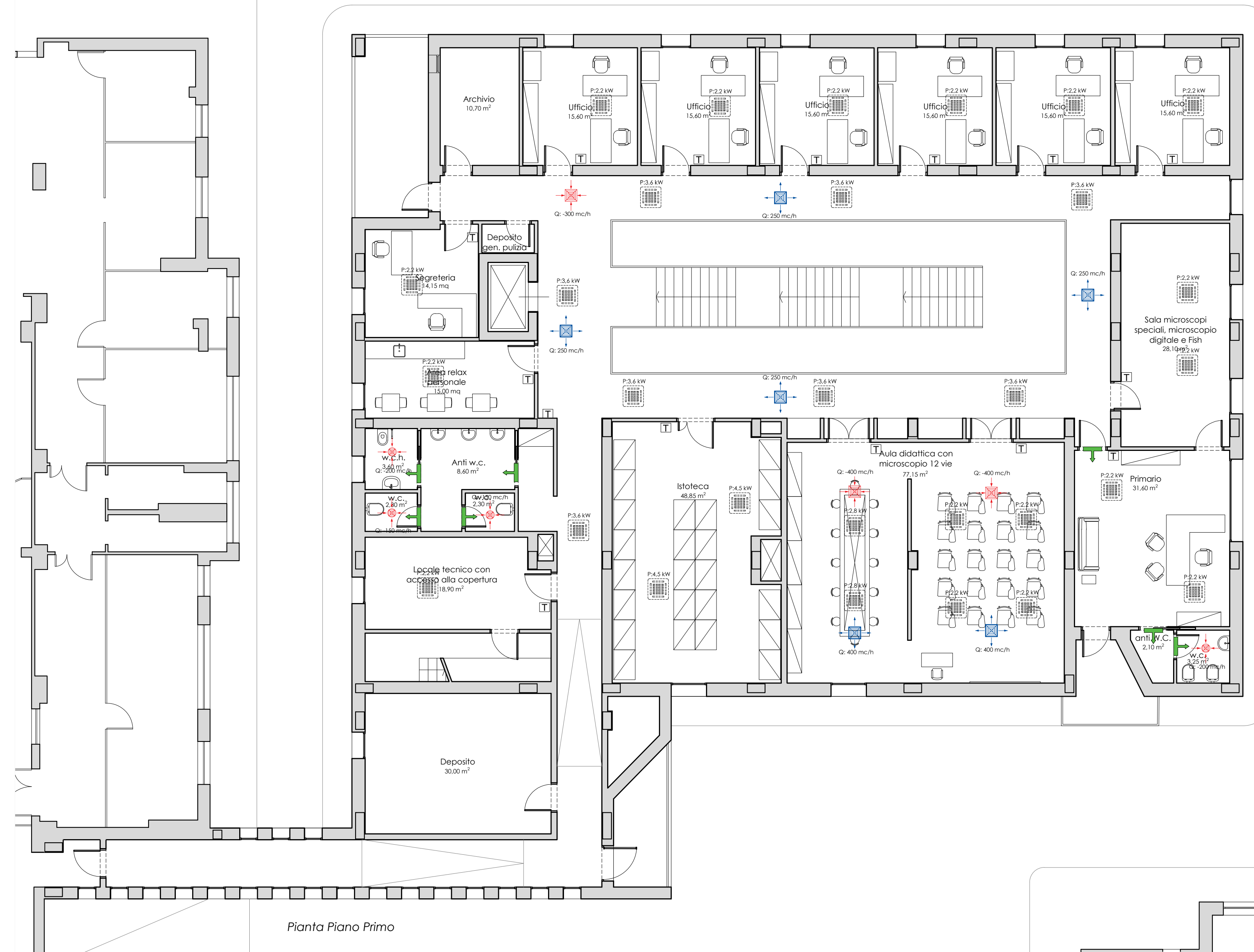
Pianta Piano Primo