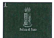
Vittoria, medicinali dell'ospedale in casa: 2 arresti