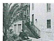
Palermo, il video dell'arresto di Ferdico