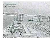
Maxi sequestro di cocaina in Calabria