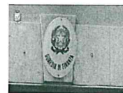
Ferdico: "Le mani sui beni sequestrati", 5 arresti a Palermo - Il video