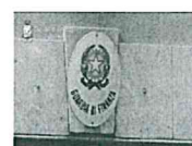
Ferdico: "Le mani sui beni sequestrati", 5 arresti a Palermo - Il video