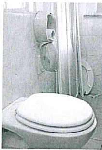
FATISCENTE Una delle foto scattate dal paziente alla sua stanza dell'ospedale Civico

che ha fatto peggiorare le sue condizioni respiratorie». I familiari denunciano anche altri episodi: «Le condizioni del reparto erano fatiscienti. In due mesi non hanno mai cambiato le lenzuola. La stanza è stata invasa dalle formiche». Nei frame del breve video girato in corsia il 13 luglio che i familiari hanno presentato ai carabinieri, si vede una fila di formiche correre lungo i telai della finestra e lungo il battiscopa. Le foto mostrano i sanitari del bagno danneggiati, con i vetri della doccia rotti e la porta lesionata priva di serratura.