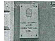
Mafia, 37 arresti tra Italia e Germania - VIDEO