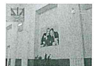
Messina, colletti bianchi nel mirino di Dia e Finanza