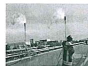
Incidente sulla A-19, chiusa la Palermo-Catania - Il video