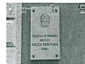
Mafia, 37 arresti tra Italia e Germania - VIDEO