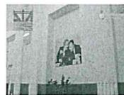
Messina, coltetti bianchi nel mirino di Dia e Finanza