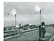
Incidente sulla A-19, chiusa la Palermo-Catania - Il video