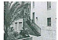
Palermo, il video dell'arresto di Ferdico