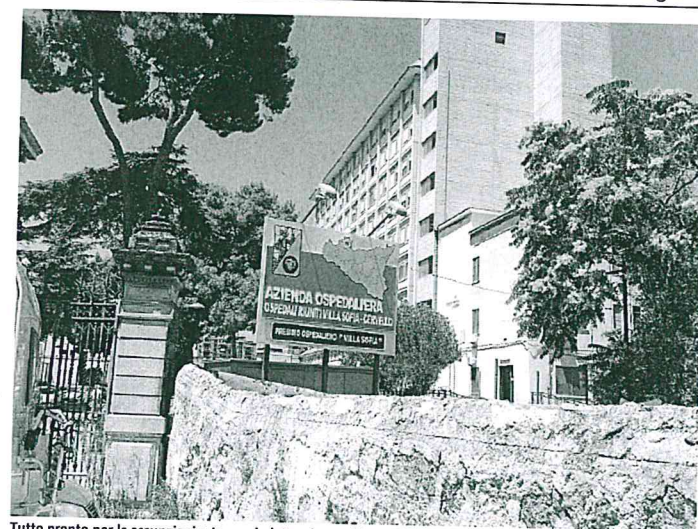
Tutto pronto per le assunzioni a tempo indeterminato all'ospedale «Villa Sofia»

L'azienda continua su una strada che era stata già intrapresa a giugno: all'inizio del mese, erano stati assunti a tempo indeterminato 7 anestesisti, pure impiegati nelle aree di emergenza-urgenza, a dimostrazione che si tratta di un punto nevralgico. «Abbiamo chiuso un percorso lungo - sottolinea il direttore generale, Gervasio Venuti, ormai alle battute finali del suo mandato, prima di andare a dirigere l'Asp di Agrigento - per aprirne oggi uno nuovo che porta questa azienda a tornare ad assumere a tempo indeterminato dopo diversi anni, offrendo finalmente risposte a diversi medici, in-